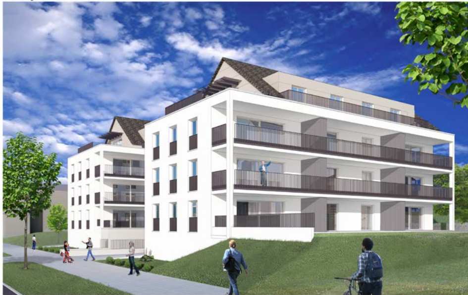
Bebauung Karl - von - Hahn Strasse

Hochwertige NEUBAU 3-Zimmer Penthouse-Wohnung in ruhiger und sonniger Lage -Wohnung 10.2-