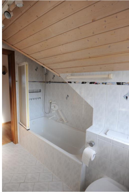
Bad mit Wanne