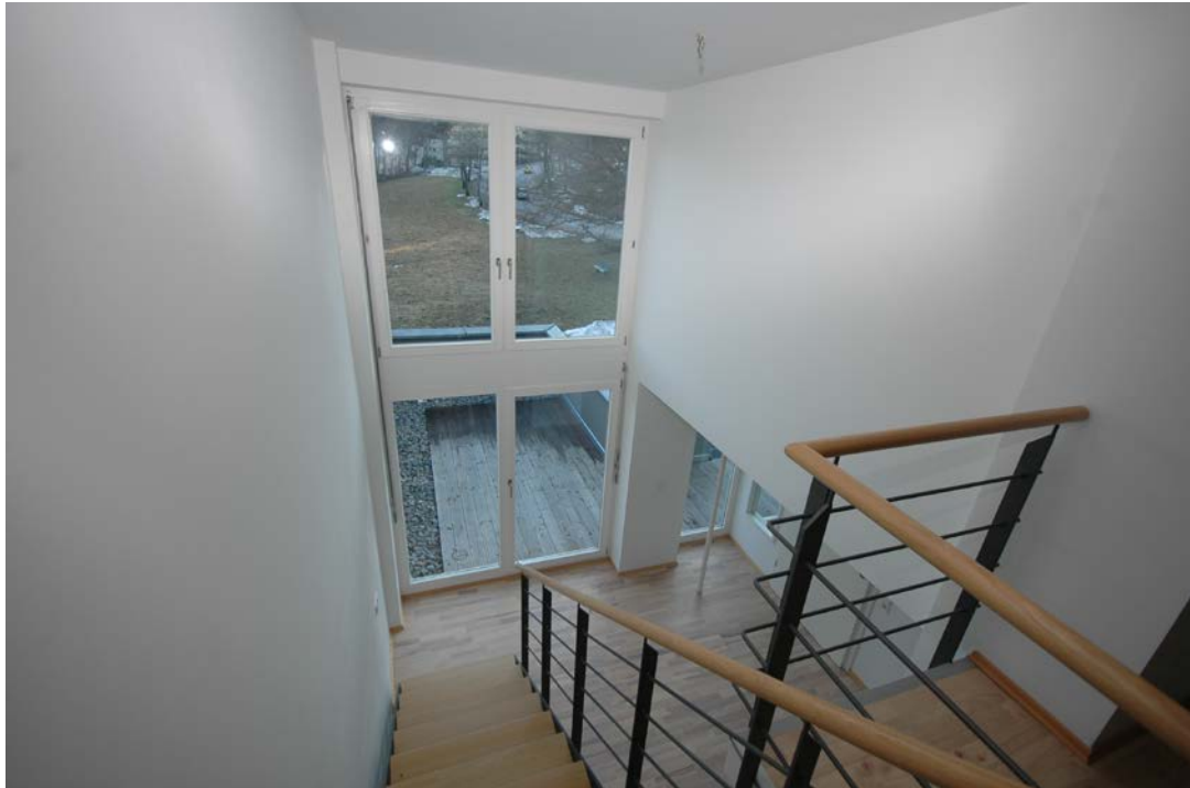
Treppe und Fensterfront