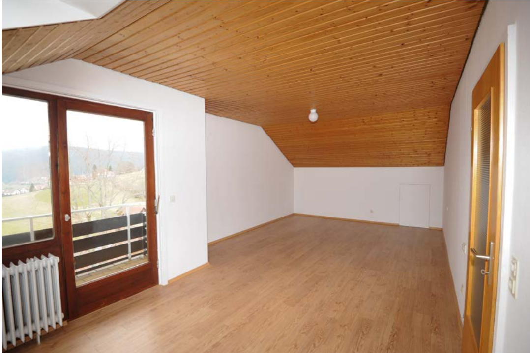
Schlafzimmer mit Nordbalkon