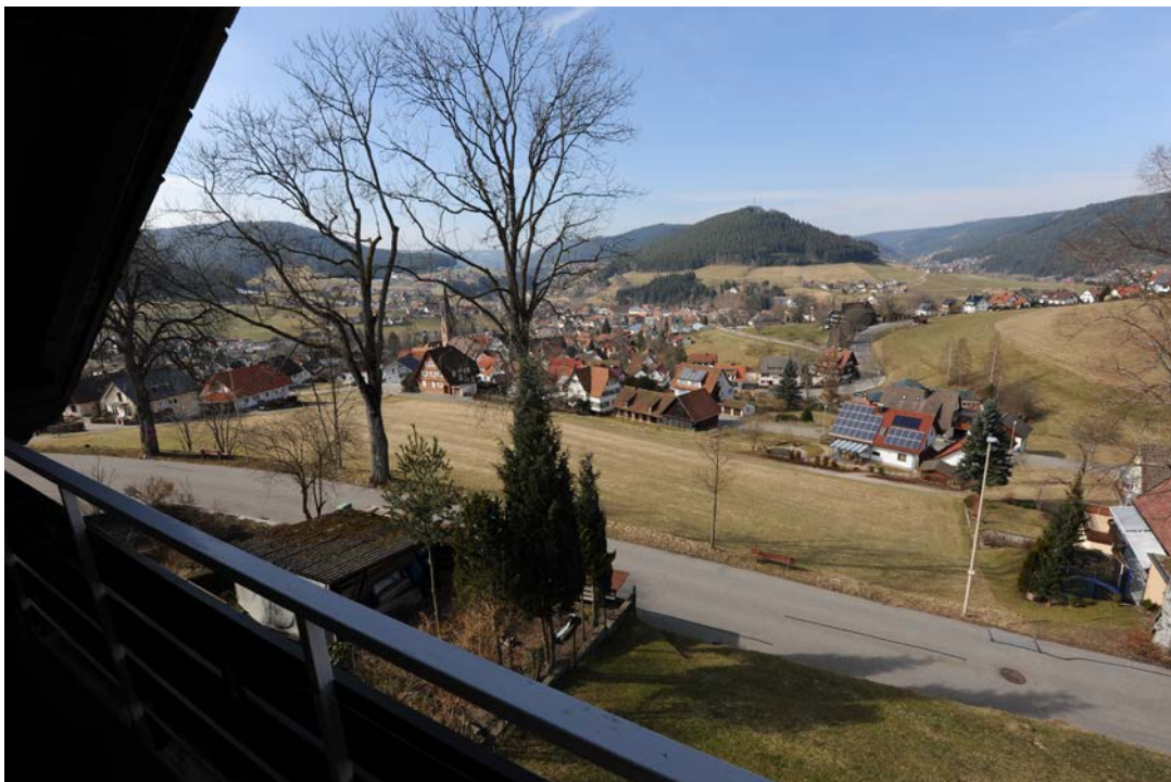
Aussicht vom Nordbalkon