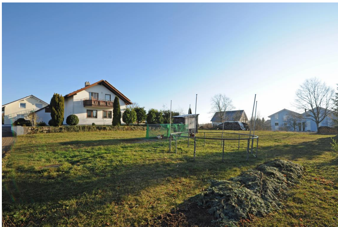
Nordansicht mit Blick Richtung Süden