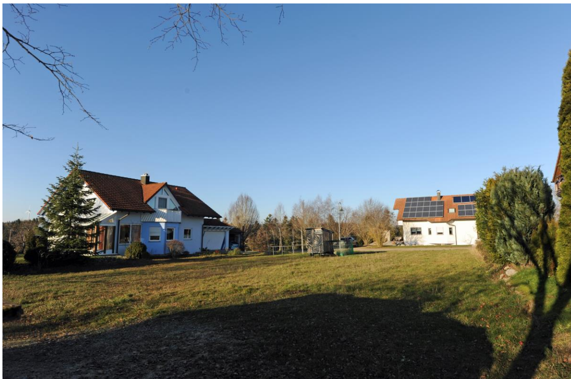
Südansicht mit Blick Richtung Norden