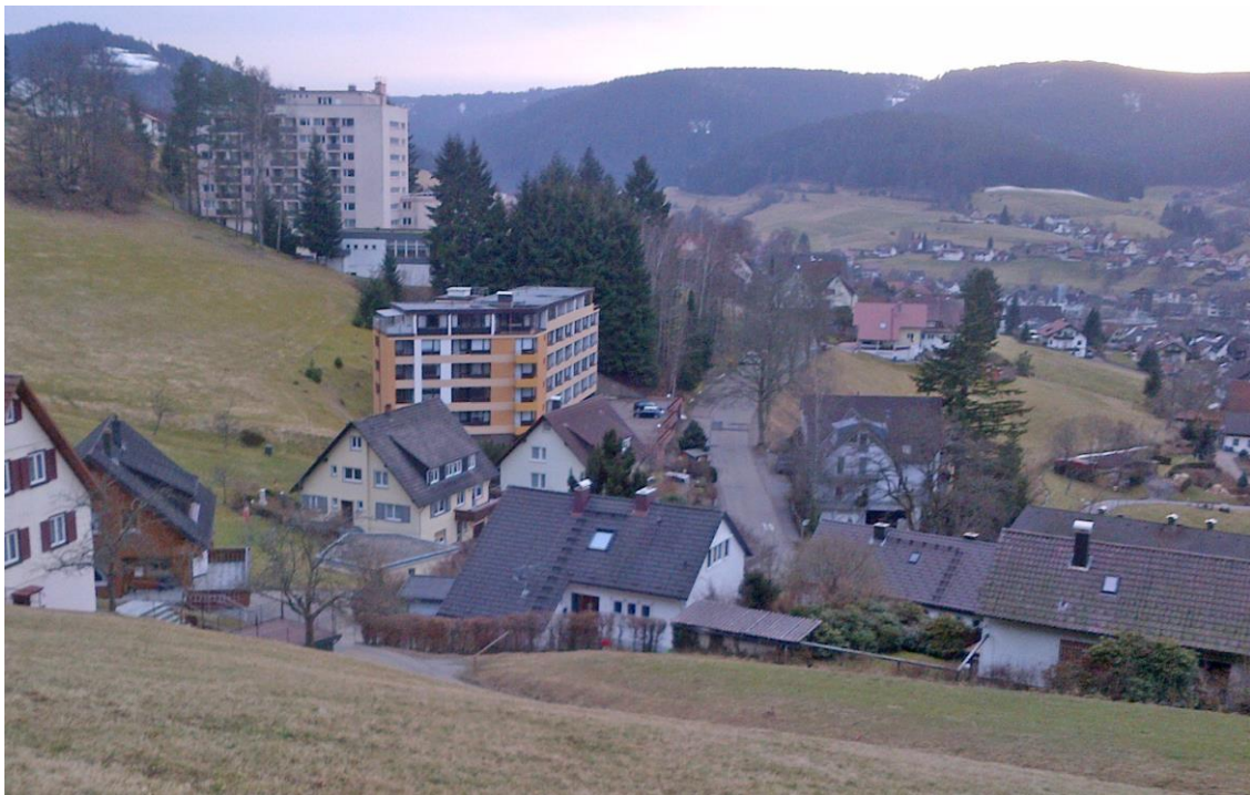
Blick auf das Haus (Orangefarbene Fassade)