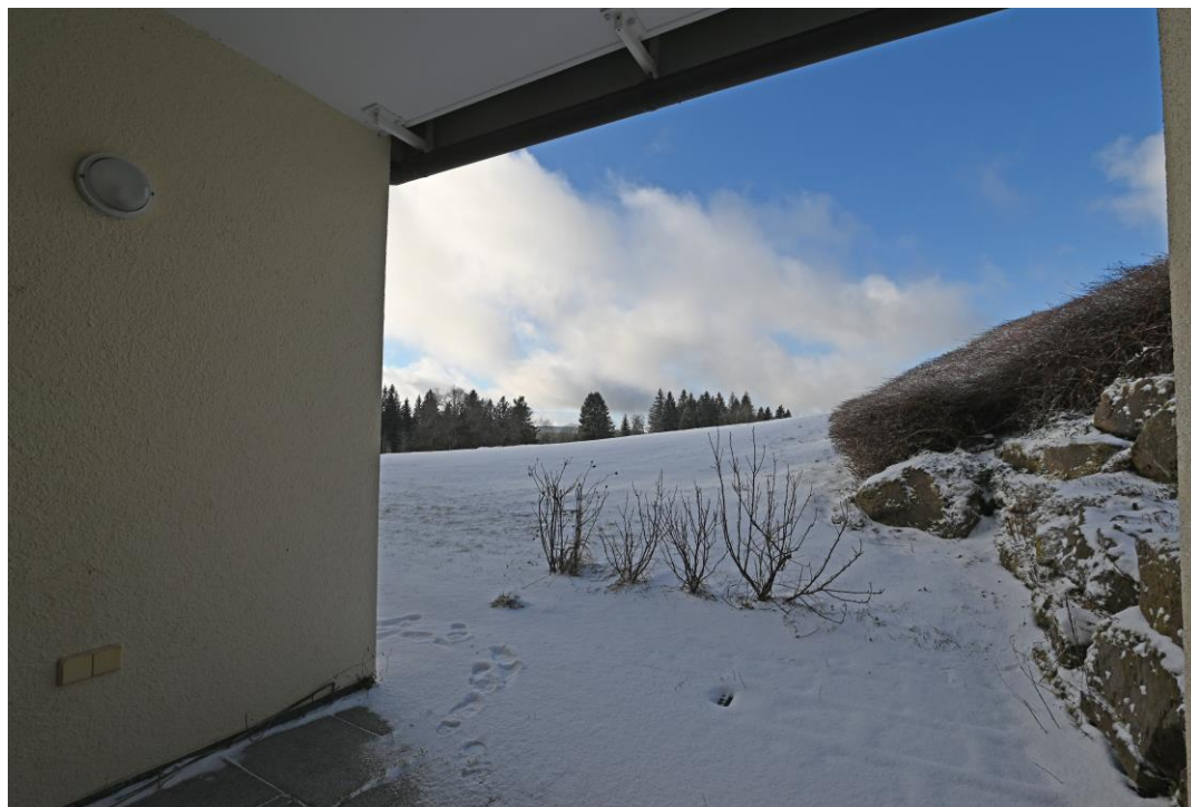
Teilweise überdachte Terrasse