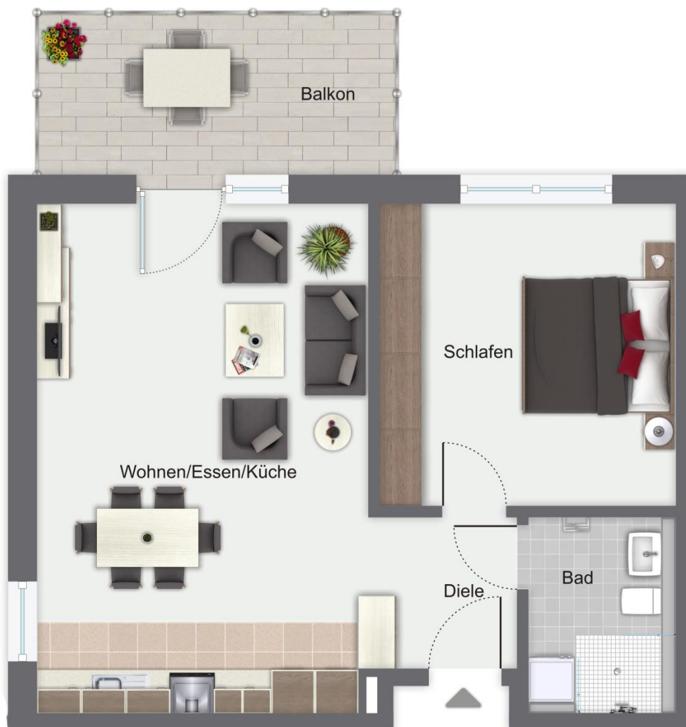
Wohnung 20 im 2.Obergeschoss