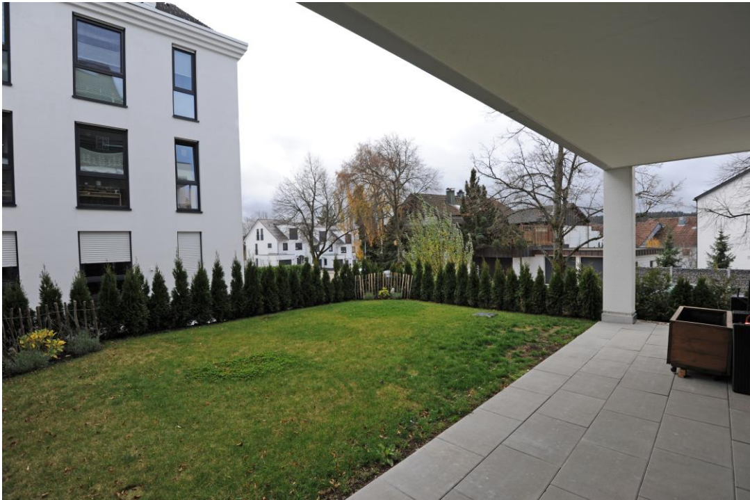
Terrasse mit Garten