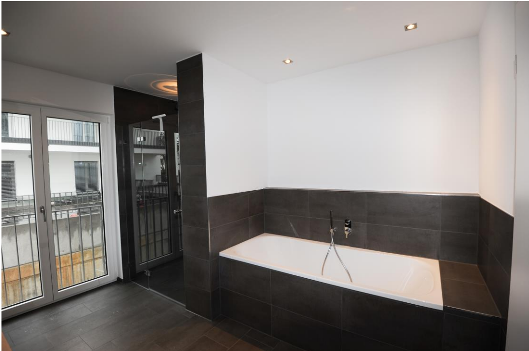
Badewanne und Dusche